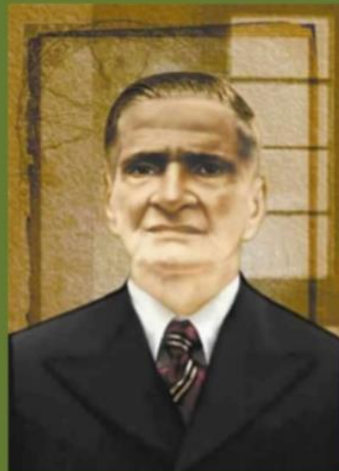
Zélio de Moraes (1891 — 1975)

Congregação Espírita Umbandista do Brasil