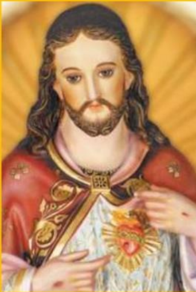
Mestre Supremo JESUS FILHO DE DEUS