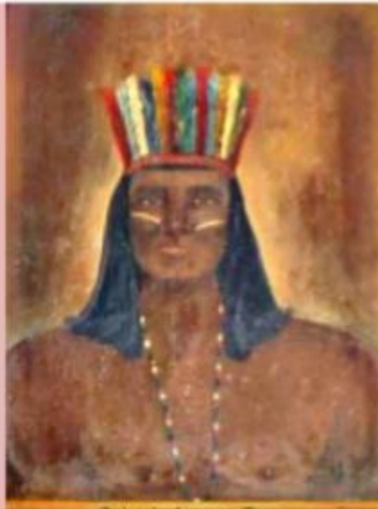
Caboclo Arranca-Toco Templo Umbandista A Caminho da Luz